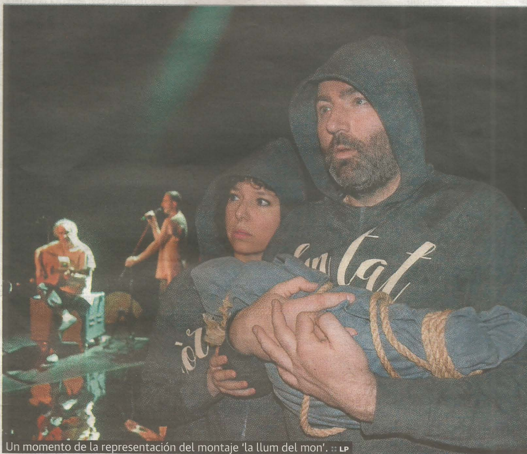
Un momento de la representación del montaje 'la llum del món'.

El recorrido lineal discurre desde el Génesis al Apocalipsis con divertidas secuencias. A la tentación de la serpiente a Eva le sigue una fábula de diálogos de especies animales que no entraron en el arca de Noé durante el diluvio universal. La travesía por el desierto de los judíos del 'Éxodo' con tres seres anónimos, posee una fina ironía, como la añoranza a que en Egipto comían. Conti-